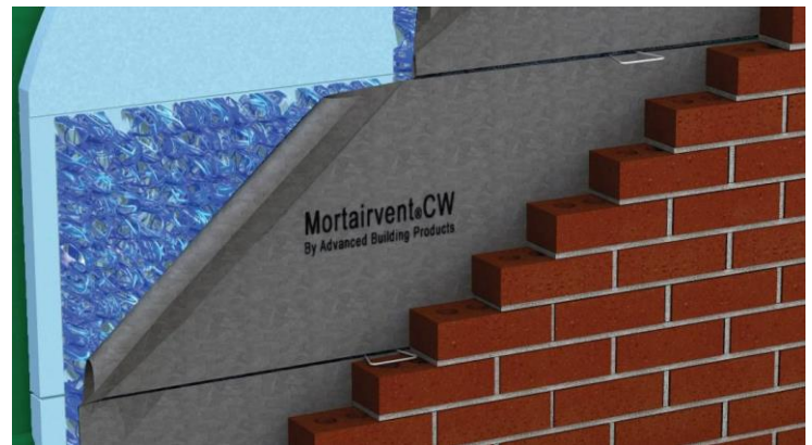
Mortairvent® CW se instala fácilmente mediante un laminado el producto horizontalmente entre los lazos de ladrillo.