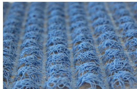
Mortairvent® (.40 in. / 10mm)